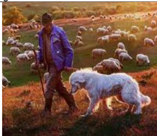
Mihály napi forgatag

A projekt megvalósulásának tervezett ideje: 2022.09.25-29.