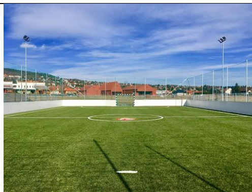
Május 14. SZOFI napja: Kerti piknik Szofiékánál