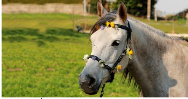
Május 20. MÁLNA napja: Medencés buli Málnáéknál