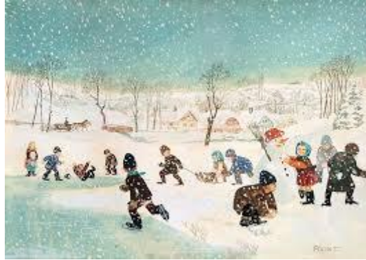
Pólya Tibor: Téli Örömök

A projekt megvalósulásának tervezett ideje: 2021.01.18.-2021.01.29.