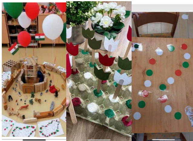
Nemzeti színű tulipán mező