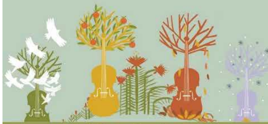
Vivaldi: A négy évszak

https://www.youtube.com/watch?v=tiQjBBU7Lug